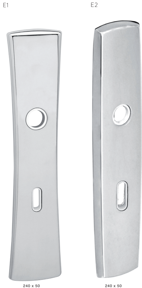
Tabela de medidas para espelhos E1 e E2